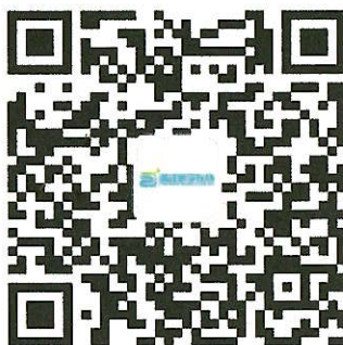
(浙江医学在线微信公众号二维码)

学员通过微信关注“浙江医学在线”公众号或微信扫描下方二维码，选择“医学培训→培训平台导航→温医大网络学院→账号绑定或者注册→远程报名”，填写相关报名信息。付款成功后可在“订单”或“我的→我的订单”找到相关订单点击“查看卡号和密码”。